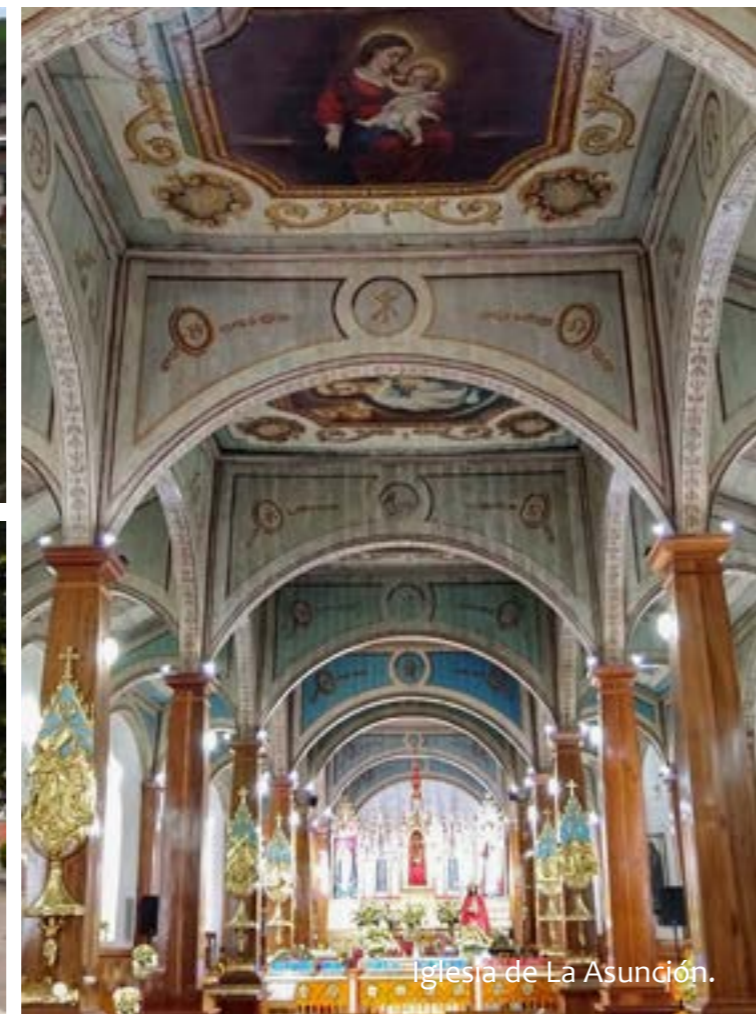
Iglesia de La Asunción.