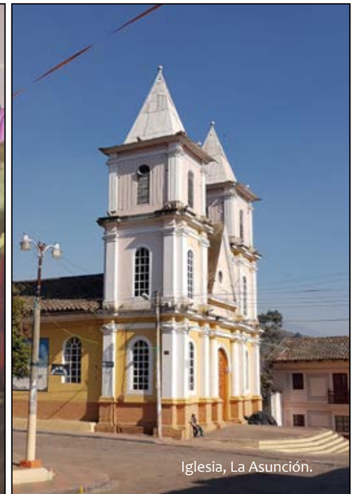
Iglesia, La Asunción.