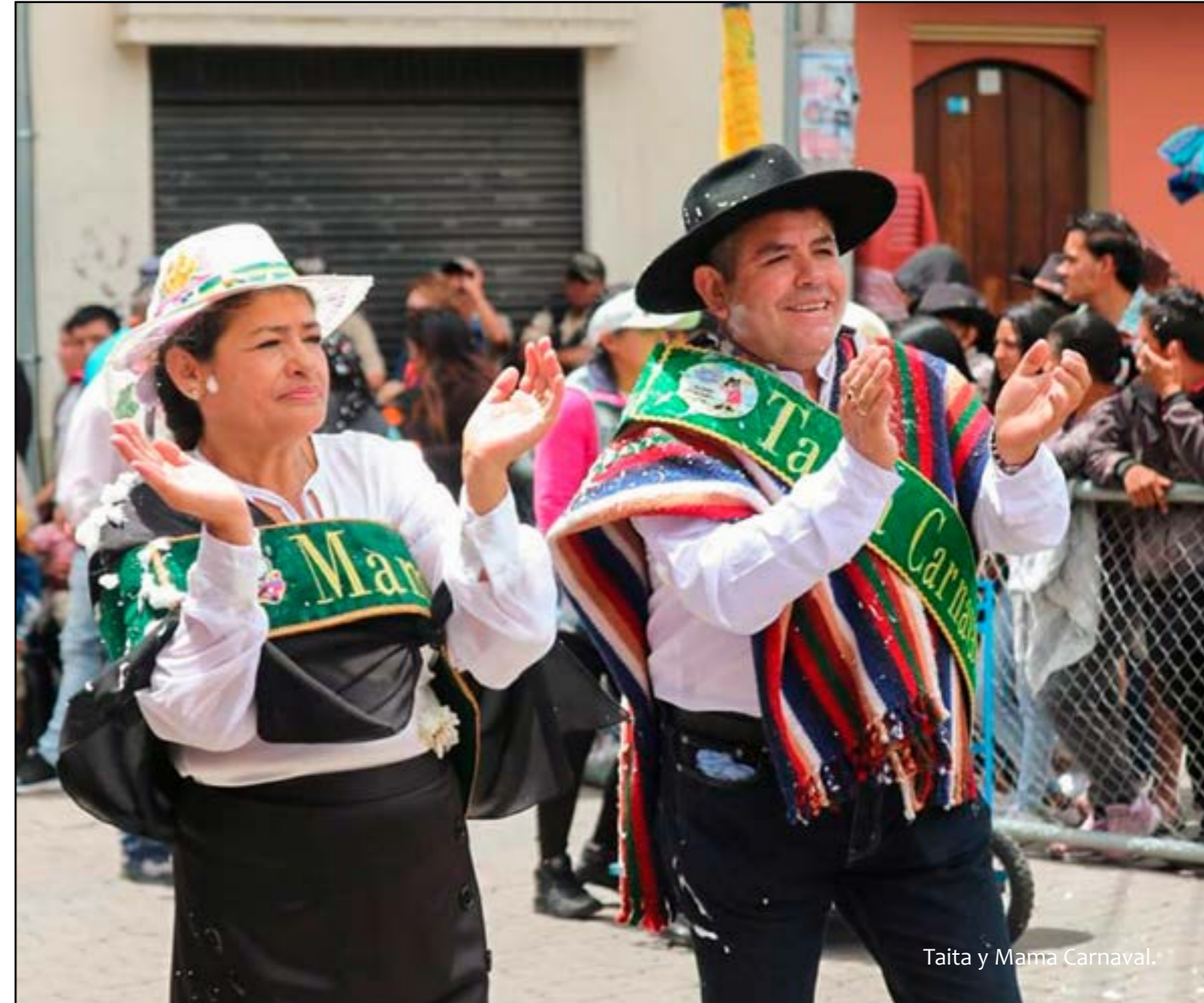
Taita y Mama Carnaval.