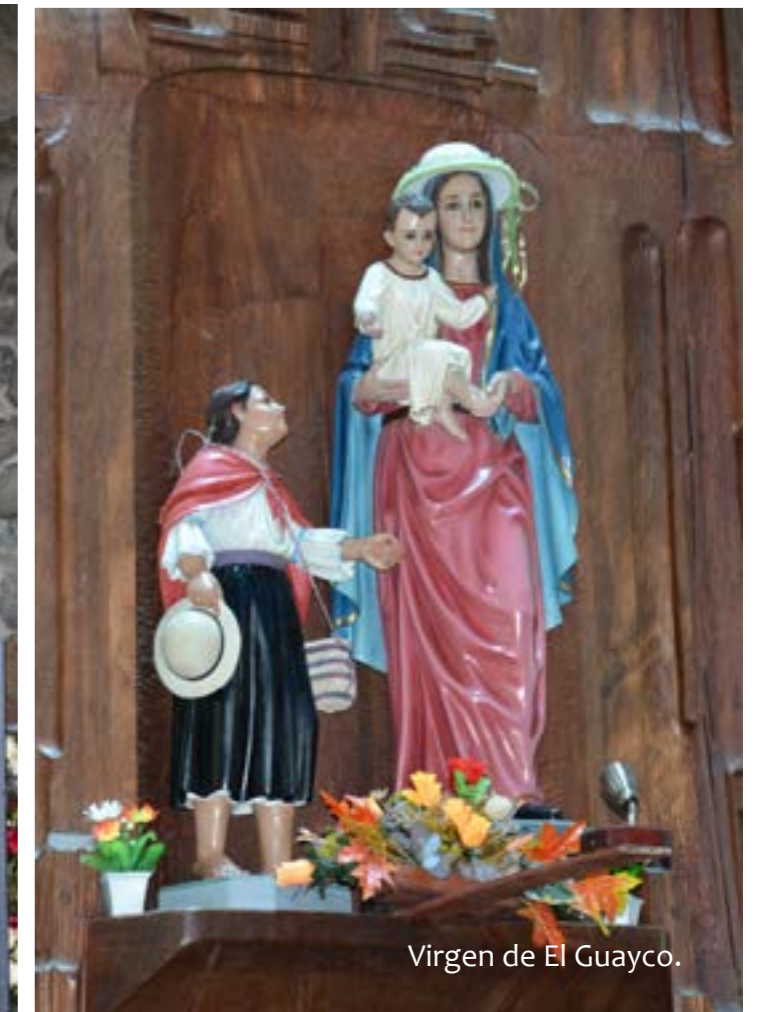
Virgen de El Guayco.