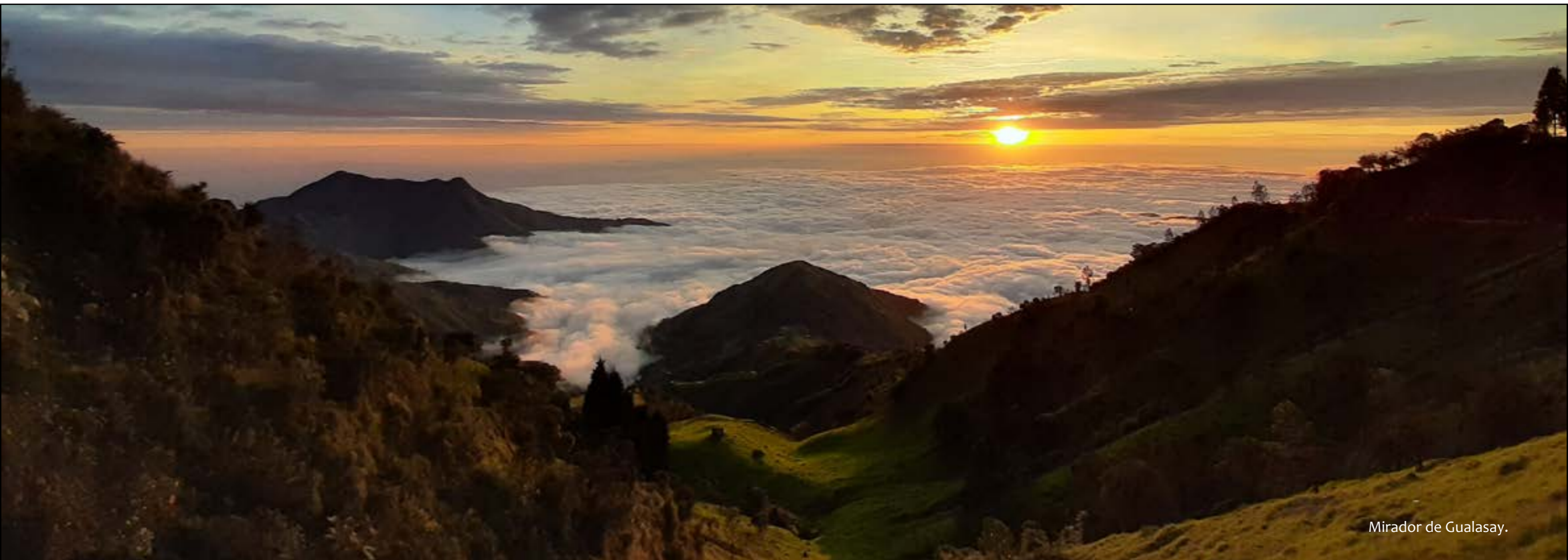
Mirador de Gualasay.

Chimbo tiene parajes y miradores que embelesan: La meseta de Cochabamba es pintoresca, atractiva a causa de los encantos topográfico y panorámico. Hacia el lado Noroeste de la ciudad se levanta el Susanga, cerro que “tiene el aspecto de una esfinge recostada vuelta el rostro mirando hacia el ocaso”. El Mirador San José, en el Catiquilla; Las Cavernas del Susanga; las cascadas: Chonta Pucará y San Francisco, en Telimbela, entre otros escenarios paisajísticos.