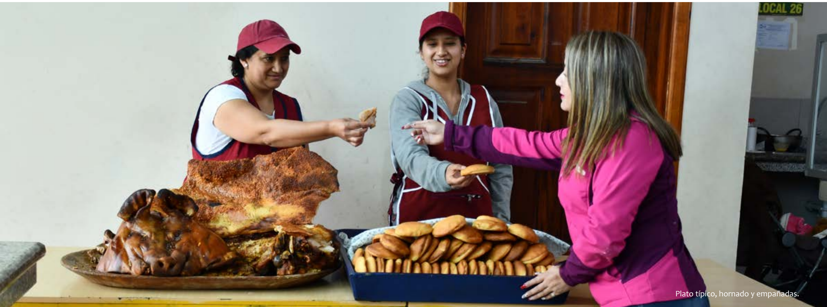
Plato típico, hornado y empanadas.

En el patio de comidas de la plaza La Merced se encuentra la venta del rico y exquisito hornado de cerdo, las deliciosas empanadas redondas, las tripitas con morcilla, los famosos rompe nucas (refrescos con hielo).