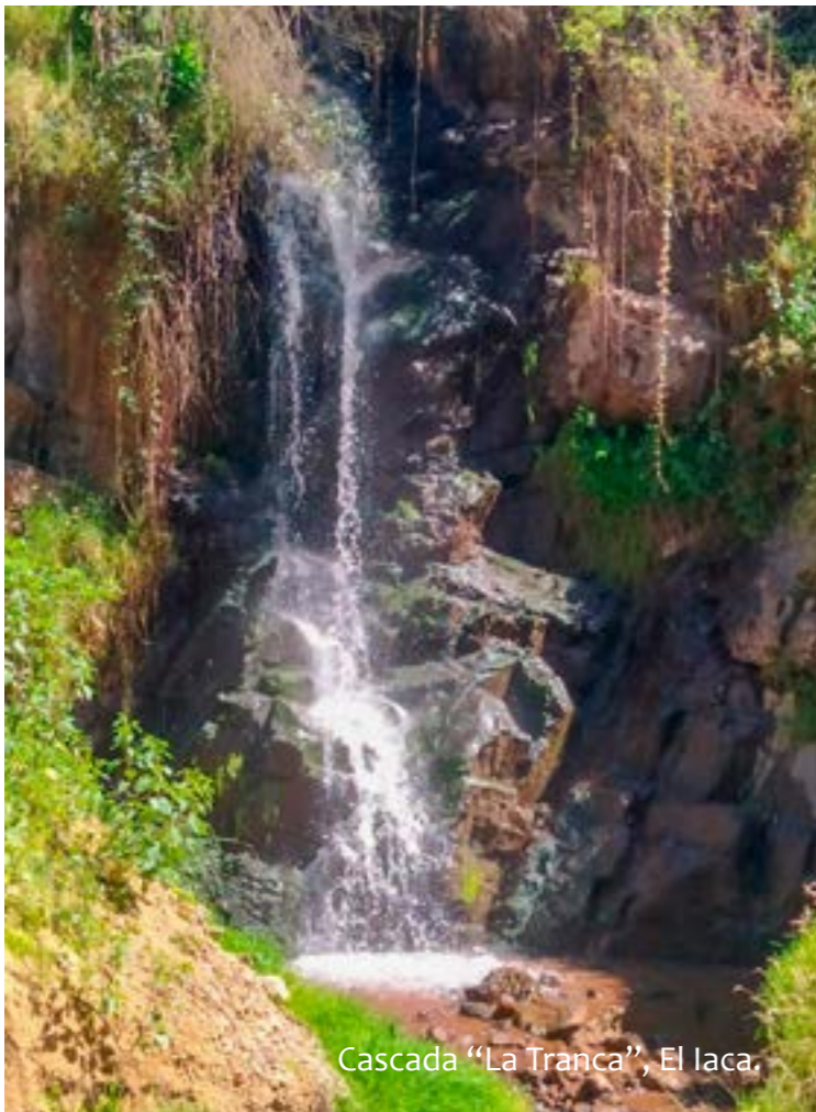
Cascada "La Tranca", El Iaca.