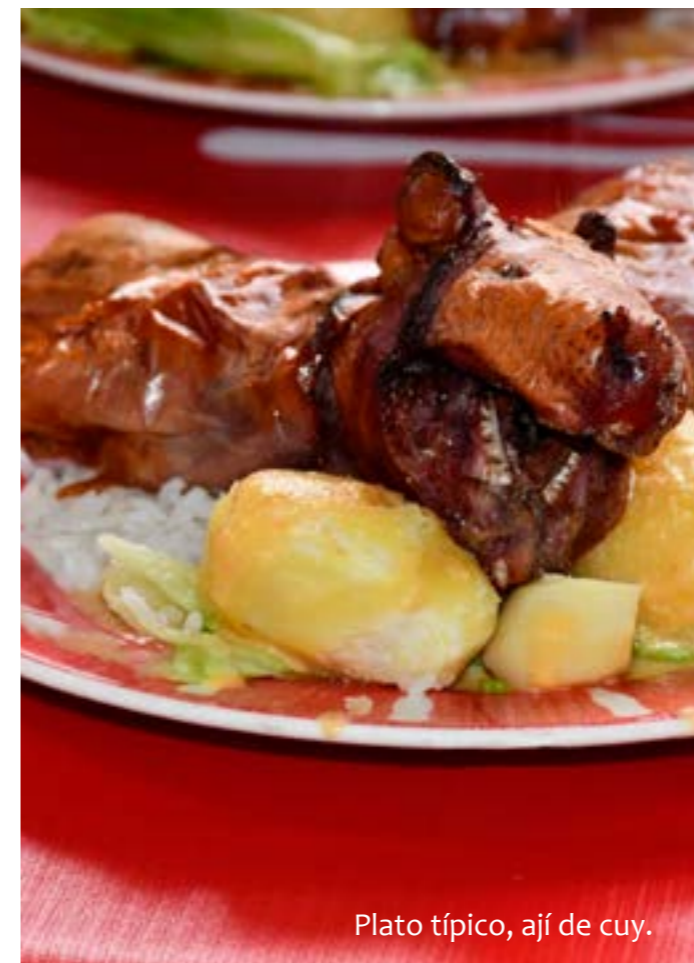
Plato típico, ají de cuy.