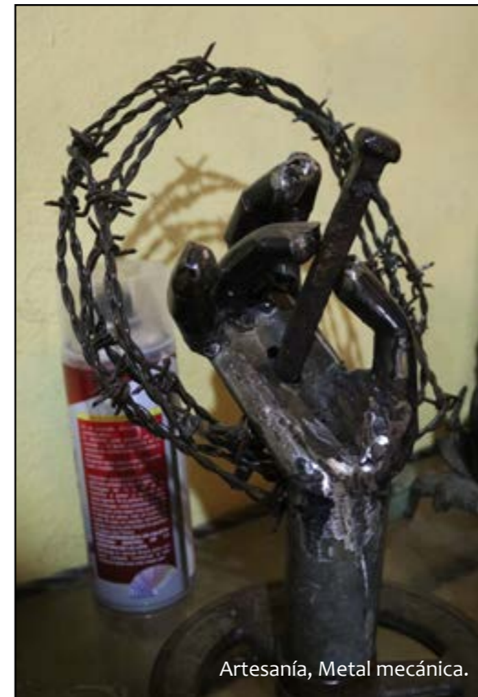
Artesanía, Metal mecánica.