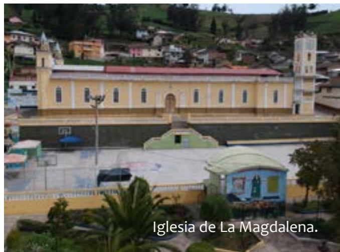
Iglesia de La Magdalena.