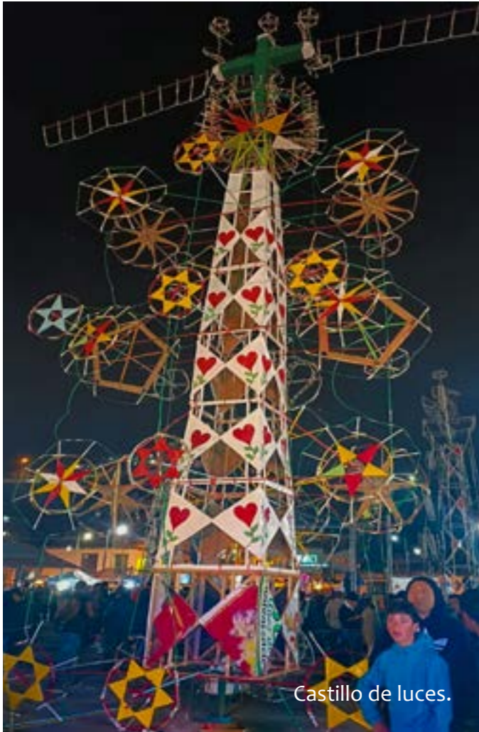
Castillo de Luces.