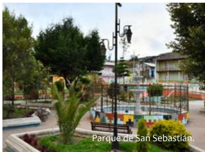
Parque de San Sebastián.