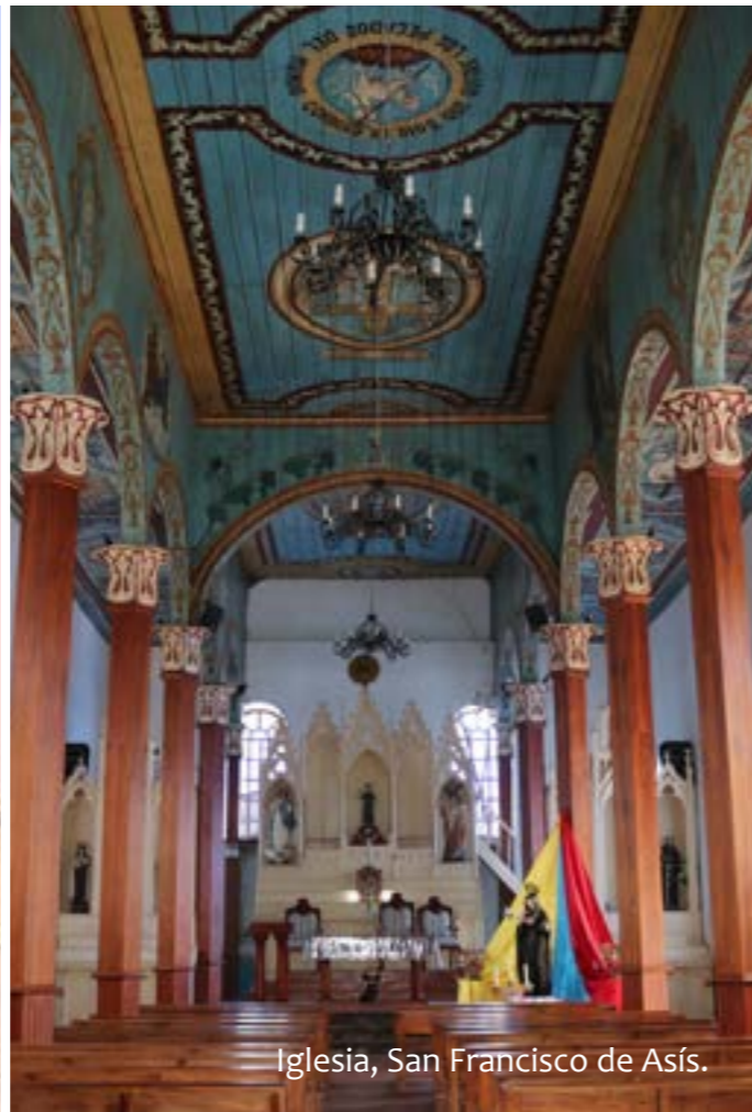
Iglesia, San Francisco de Asís.