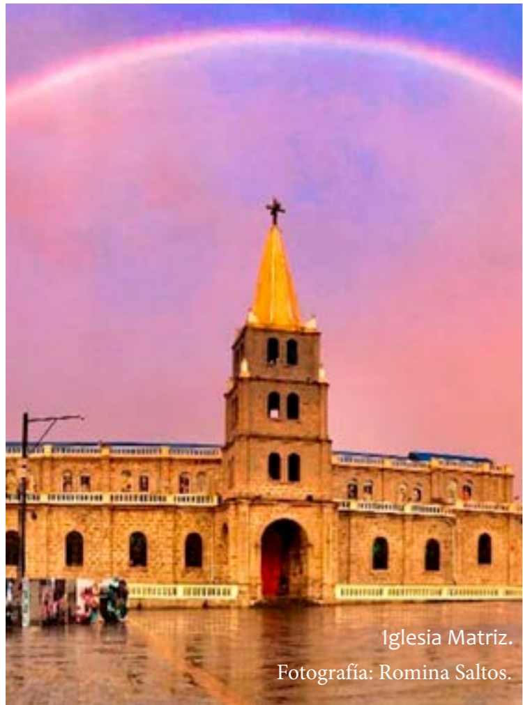
Iglesia Matriz.