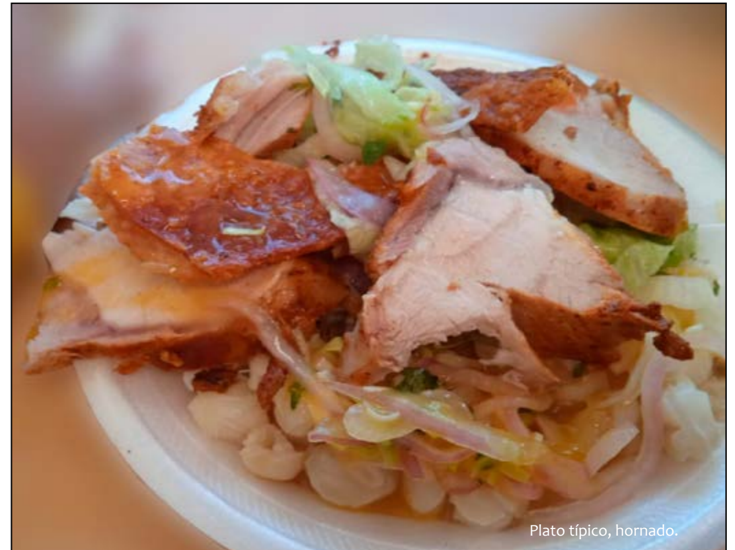
Plato típico, hornado.

Además del hornado, se elabora la fritada, el picante de gallina, el ají de cuy, el caldo de gallina criolla, los quimbolitos, chigüiles y humitas, las tortillas de maíz y de trigo. Así, también las agradables colaciones y los típicos e inigualables helados de cacho.