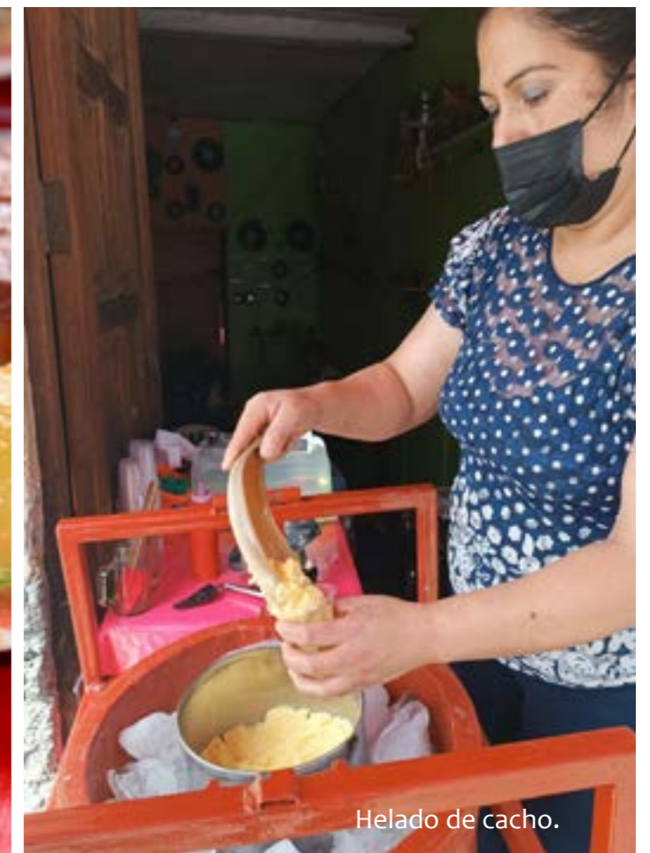
Helado de cacho.