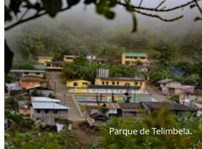
Parque de Telimbela.