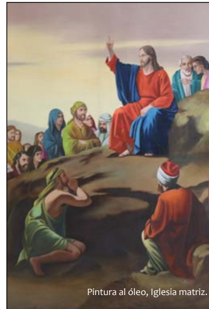
Pintura al óleo, Iglesia matriz.