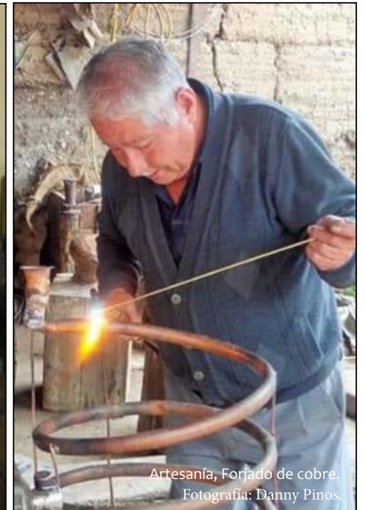
Artesanía, Forjado de cobre.