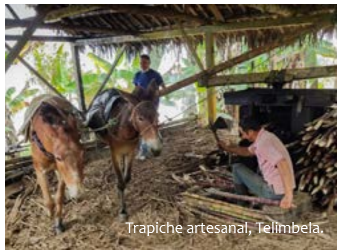
Trapiche artesanal, Telimbela.