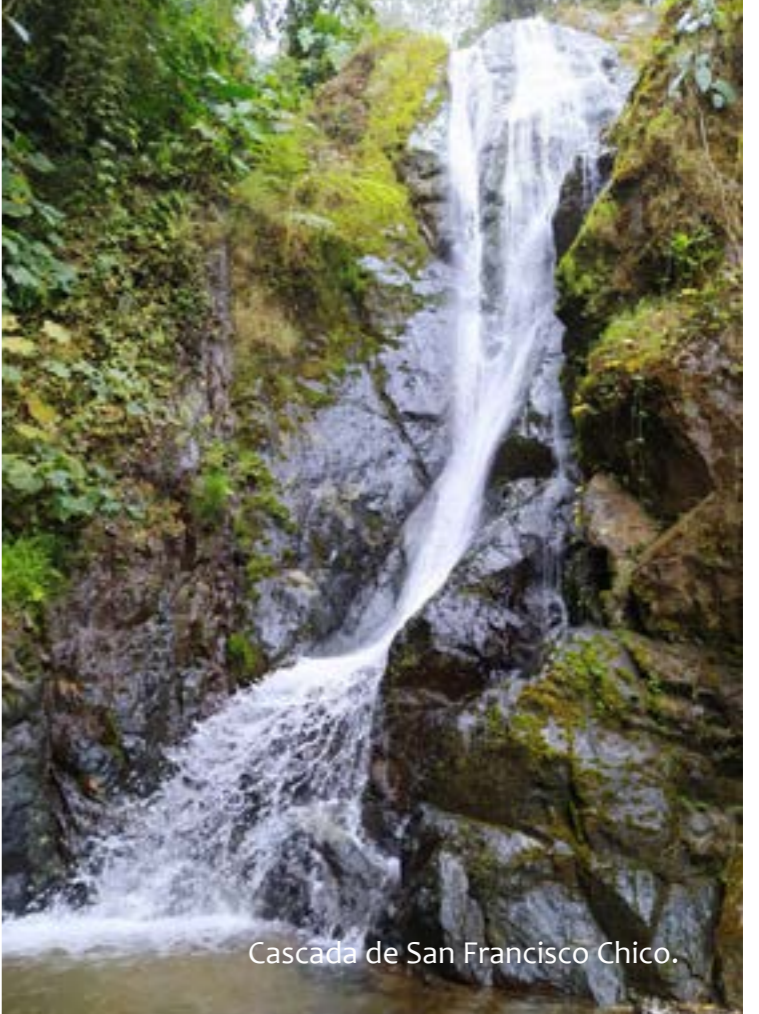
Cascada de San Francisco Chico.