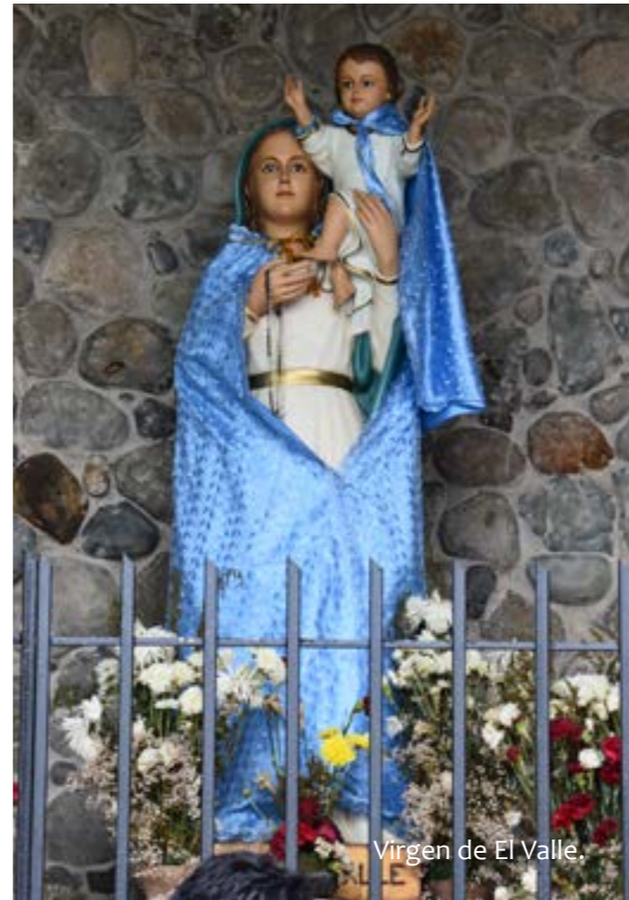
Virgen de El Valle.