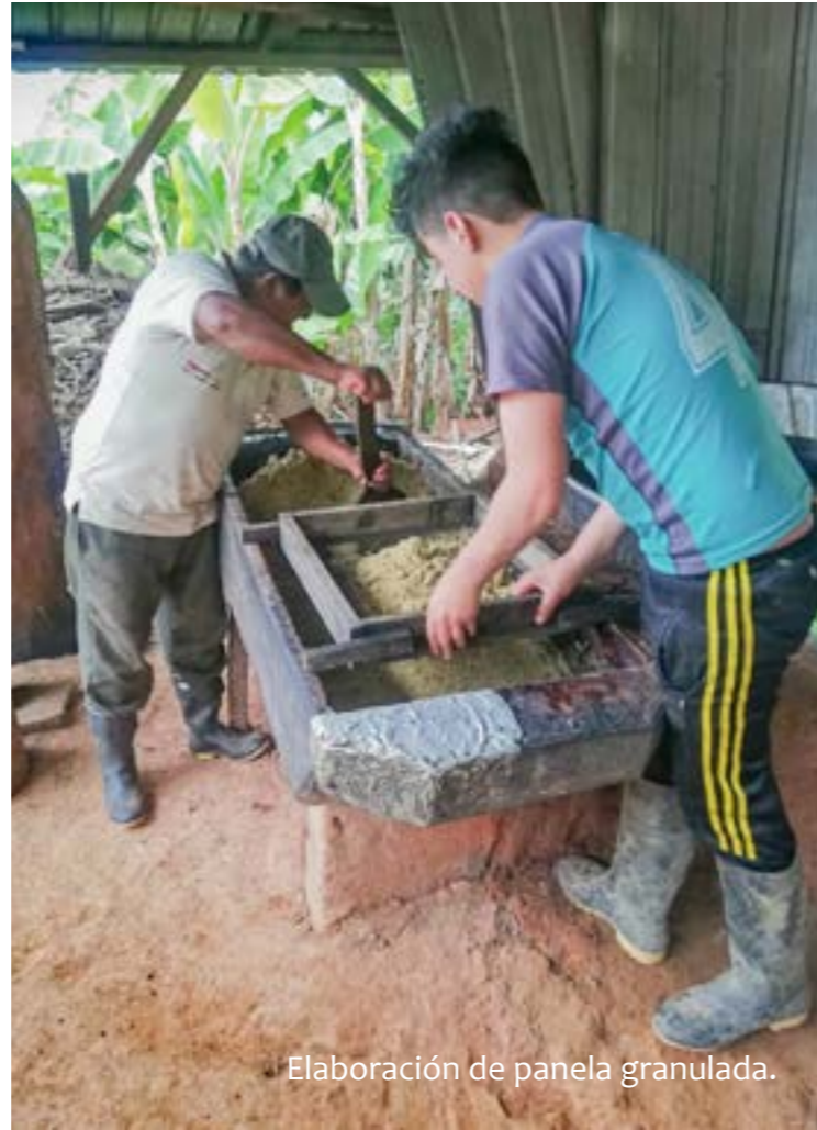
Elaboración de panela granulada.