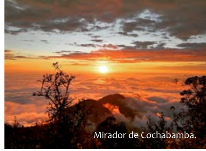
Mirador de Cochabamba.